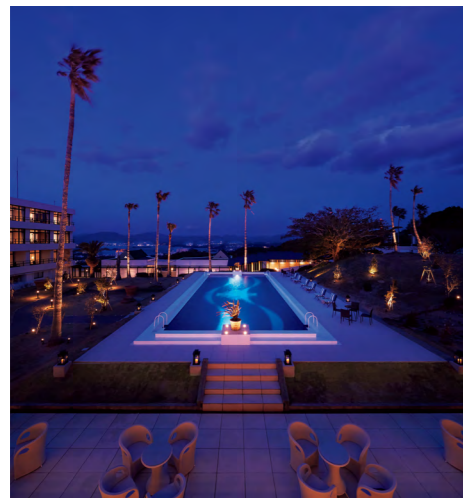
屋外プライベートプール。温水プールなので、4月末から10月まで利用できる