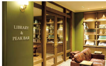
旅の本や雑誌など約100冊が並ぶライブラリーとシガーバー「PEAK BAR」