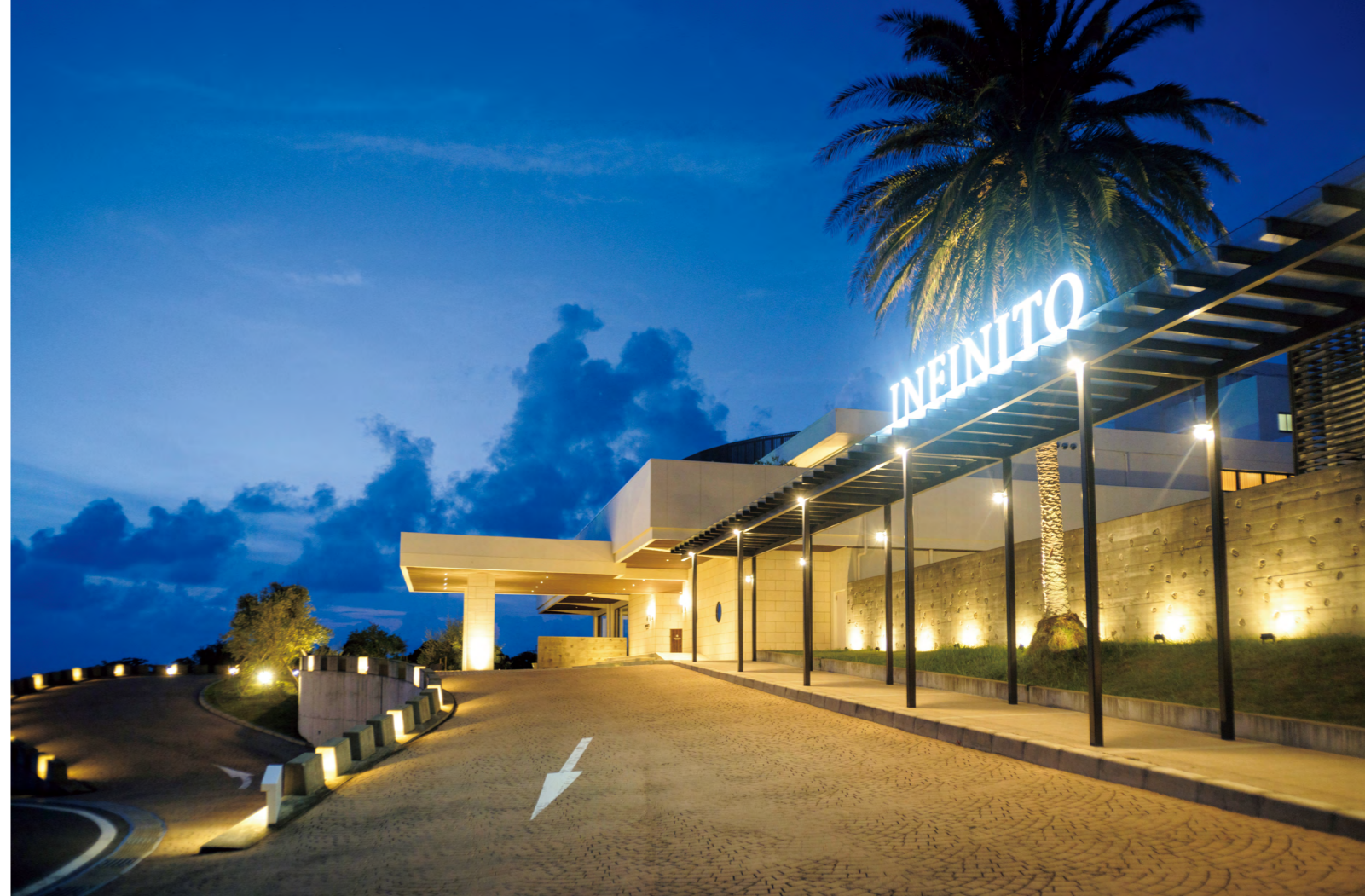
ホテルは純白の白浜と紺碧の太平洋を見渡す最高のロケーションに建ち、夕陽が沈むマジカルタイムや星空が広がる夜は、幻想的な雰囲気を感じ出す