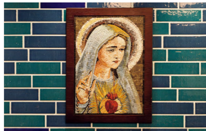
モザイク画：ヨルダン モーゼの丘の乙女とザクロ