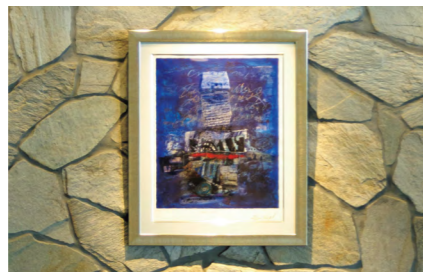
コラージュ画：ニッサン・インゲル作