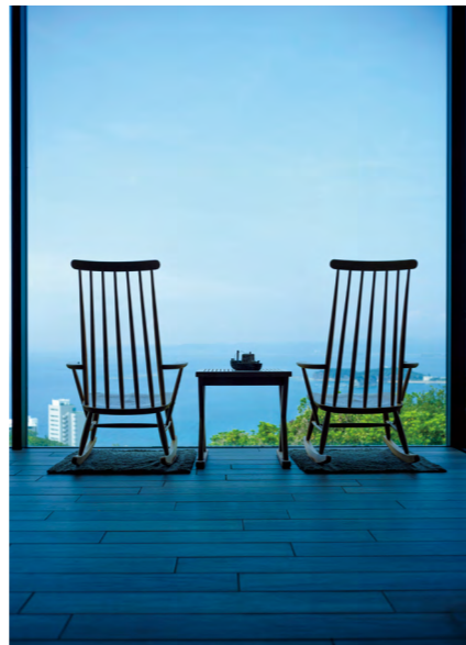
ラウンジの窓辺には太平洋を見渡すチェアが用意され、お茶を飲みながら海を眺めて過ごせる