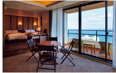
紺碧の太平洋を一望することができるラグジュアリーな客室「ロイヤルスイート」