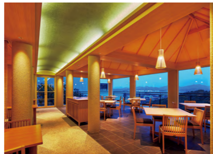
上写真：和食レストラン「凧」へと続く趣ある回廊 下写真：「凧」の店内