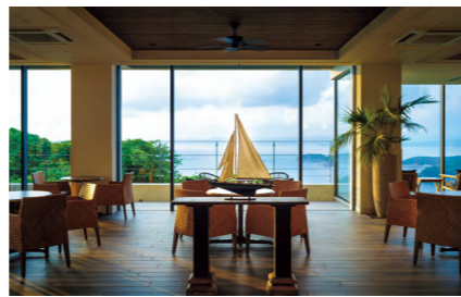
太平洋を一望するカフェラウンジ「パシフィック」