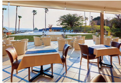
中庭のプールに続くオープンテラスの洋食レストラン「ジョヴァンニ」